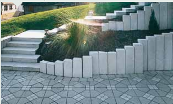
Chic sous forme d'une longue file.