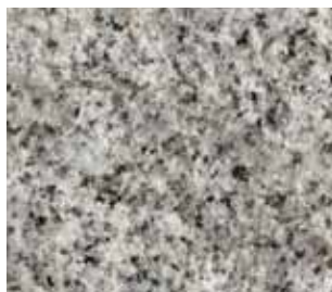
Granit gris (35 x 15 x 17 cm)