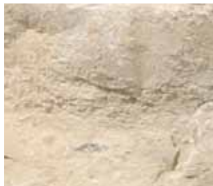
Jura (12-20 x 12-20 x 20-60 cm)