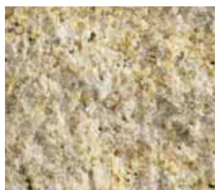
Granit jaune (La couleur des granites jaunes peut varier)