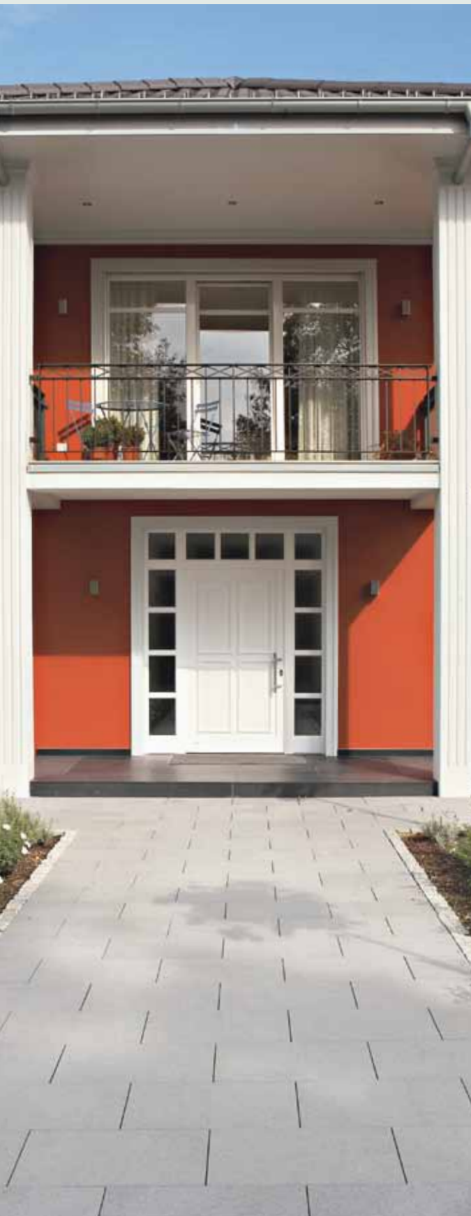
Chemins, terrasse et balcon sont embellis.