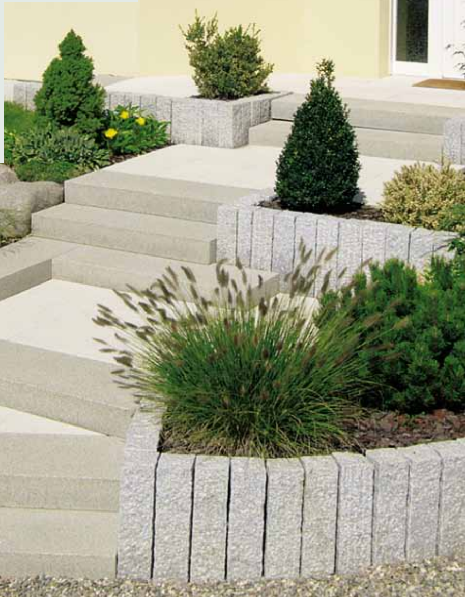
En harmonie avec les fleurs et les plantes.

Les classiques parmi les pierres naturelles : elles s'intègrent à tous les styles tout en étant d'un usage très souple. La dureté des stèles de granit naturel a du chic et donne une note personnelle aux ornements les plus simples. Pour un accueil chaleureux !