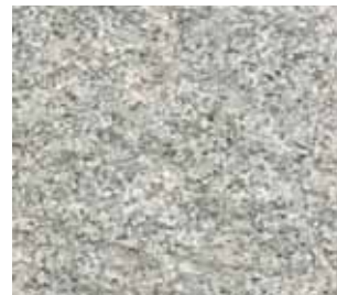
Granit gris (20 x 20 x 40-60 cm)